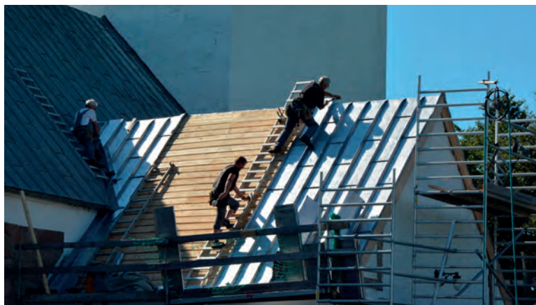
De tre blytækkere fra Hvidbjerg, Thyholm en varm sommerdag på østsiden.

Sennels Menighedsråd, oplyser, at i 2018 kom der en bevilling til taget fra Thisted Provsti på 475.000 kr. Pengene slog ikke til, bl.a. fordi Nationalmuseet ønskede undersøgelser og opmålinger af den gamle tagkonstruktion. Der kom så i 2020 en ekstra bevilling på 75.000 kr.