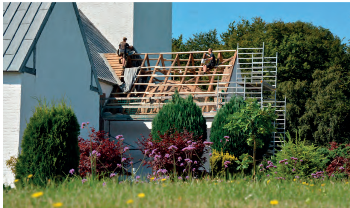
Tømmerne fornyer lægterne på det gamle tag.

delalderen ombyggede trækirker til stenkirker i 1100-tallet. Cisterciensermunkene var de første blytækkere, og de første danske blytage var i Løgumkloster og Esrum. Der er ca. 1200 blytækkede bygninger i Danmark, overvejende kirker i Jylland. Under 1. verdenskrig blev mange blytage udskiftet med naturskifer, da man andre steder i Europa havde mangel på bly. I Raadvad har man konstateret, at et blytag kan have en levetid på op mod 200 år. Alderen på vores våbenhus-tag i Sennels har altså nærmest sat Danmarksrekord, og det har måske noget at gøre med, at det ligger på nordsiden. Sydsiden er nemlig særlig udsat på grund af større temperaturudsving. Skader er oftest stormskader, kun