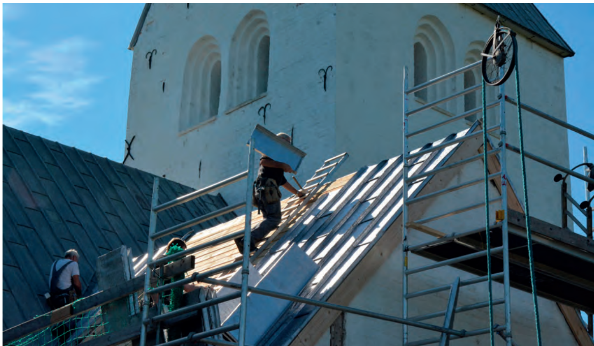
Det er hårdt og tungt arbejde - en blyplade vejer 20 kg.

sjældent støbefejl eller tækningsfejl. Dernæst skyldes skaderne korrosion, da syreregnen kan angribe blyet.